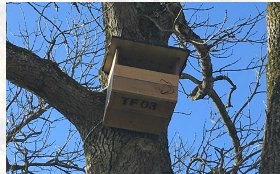
TF under kassen står for tårnfalk. 03 er en fortsat nummerering.

Ved Glenstrup Kirke fandt gruppen et velegnet stort træ (tæt på norddiget ved den lille låge) til en tårnfalk-redekasse. Menighedsrådet takkede ja til at få sat en redekasse op mod en beskeden betaling af kørsel. Vi håber, den vil blive beboet!